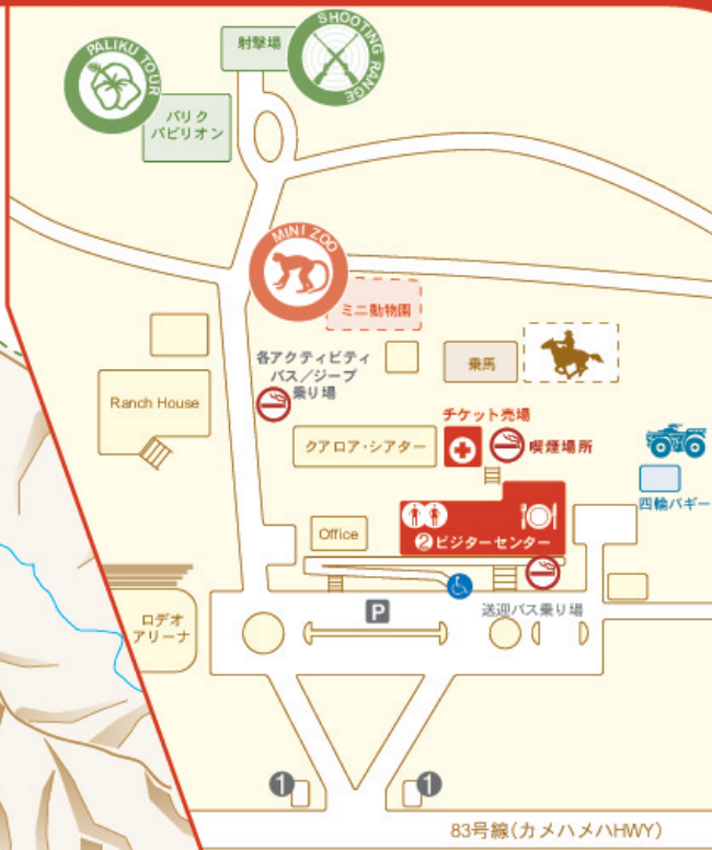
ビジターセンター・エリア拡大マップ