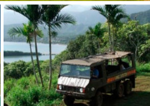
ジャングル・ジープツアー