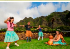
古典フラレッスン