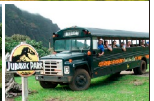
映画村バスツアー