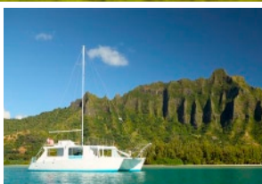
カネオヘ湾クルーズ